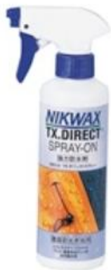
TX.ダイレクトスプレー