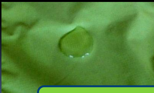
撥水機能が落ちて水玉にならない